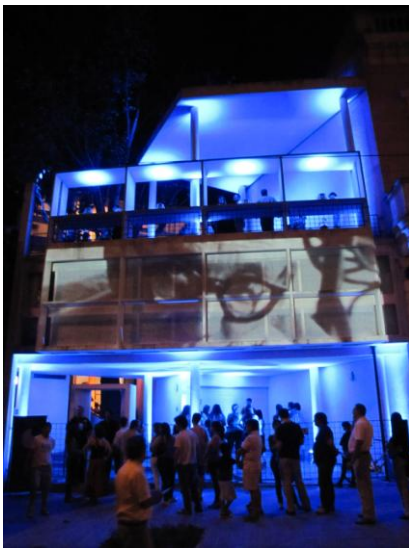
1- Registro fotográfico de la proyección realizada en la fachada de la casa Curuchet.

Estamos frente a una tipología de obra de escala mayor de lo real, que oscila entre lo racional y lo irracional, tratando de usar tecnología de avanzada y generar producciones sensibles, y cuyos antecedentes más inmediatos son el videoarte, las instalaciones, y las videoinstalaciones.