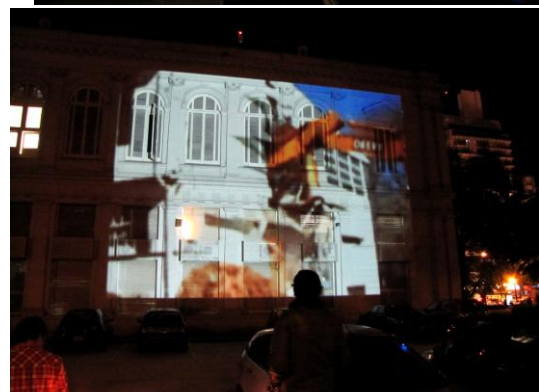
3 y 4- Registro fotográfico de la proyección realizada en la fachada del Rectorado.