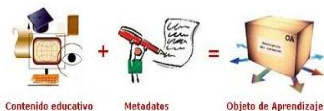
Figura 1 – Concepto de Objeto de Aprendizaje. (Berlanga et al. 2006)

cumplan los requisitos marcados. Finalmente la conjunción de los contenidos educativos y los metadatos describen un OA.