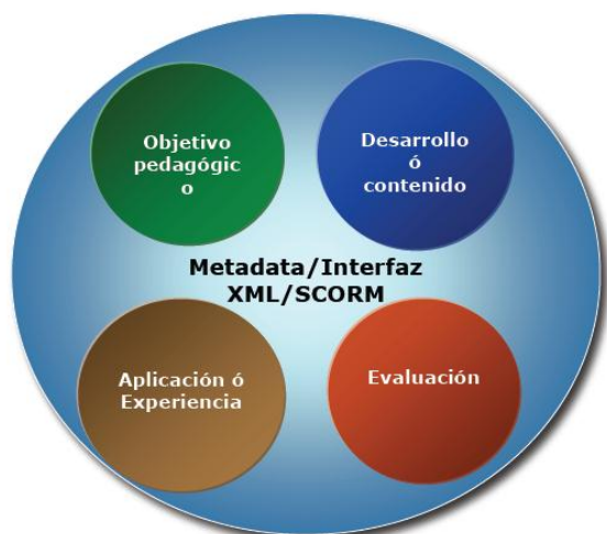
Figura 2 – Estructura de un Objeto de Aprendizaje. (Urrutia Osorio et al. 2007)