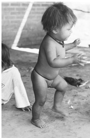
Figura N° 2: niño Mbya dando los primeros pasos solo

Con relación a ello, la oportunidad, características y frecuencia de movimientos y desplazamientos dependen de las características del espacio en el que el niño o niña puede y/o quiere moverse, lo que hace posible entender en qué circunstancias los cuidadores y cuidadoras permiten o restringen sus desplazamientos. Al respecto, existen ocasiones en las cuales se limita intencionalmente el desplazamiento del niño o niña, y es cuando se considera que puede existir un riesgo para él o para ella, o cuando el cuidador o cuidadora no puede abandonar la tarea que está realizando para seguir sus movimientos. No obstante, en general los padres y las madres permiten que sus niños y niñas se desplacen y se muevan a través del patio y de los alrededores de la casa. Excepto durante el sueño, cuando los lactantes permanecen dentro del ky’á (hamaca) por algunas horas (Ver figura N° 2), no hay ningún otro objeto o construcción que sirva a los fines de restringir el movimiento de los niños y niñas. Por el contrario, cuando comienzan a reptar o gatear se les permite “explorar” el entorno durante sus desplazamientos, los que al comienzo son cortos y atentamente vigilados por sus cuidadores y cuidadoras. Asimismo, si bien se asiste a los niños y niñas durante sus primeros pasos, se deja libertad para que ensayen el equilibrio y la marcha sosteniéndose de diferentes elementos disponibles en el espacio de la galería o patio, como así también del cuerpo de otras personas.