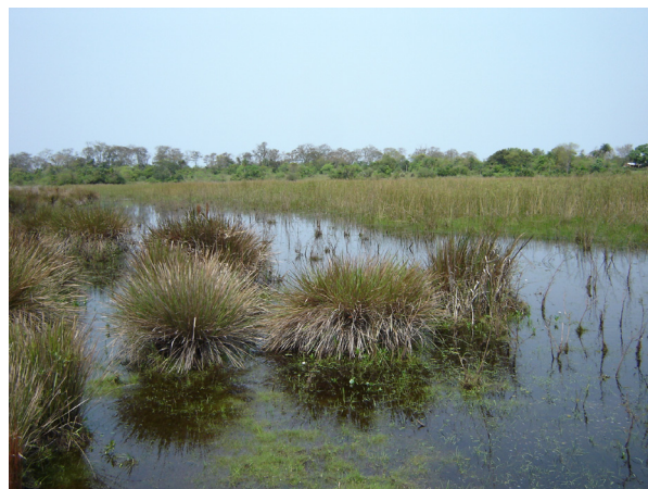
Figura 2. Hábitat de Rhinella azarai en la Reserva Natural Provincial Isla Apipé Grande (Corrientes, Argentina).

Con respecto a la dieta, el 91% ( n=20 ) de los estómagos analizados presentaron contenido. Se encontró un total de 180 presas entre las que se identificaron himenópteros, coleópteros y hemípteros. El análisis del contenido digestivo se resume en la Tabla 1. En cuanto a la jerarquización de la dieta, Hymenoptera (todos pertenecientes a la familia Formicidae) fue categorizada como fundamental, Coleoptera (Carabidae, Crysomelidae, Curculionidae, Elateridae, Scarabeidae y otros no identificados) como accesorio y Hemiptera (Heteroptera) como accidental. Esta tendencia al consumo de hormigas coincide con lo observado en otras especies de Rhinella del grupo granulosa del nordeste argentino, tales como R. bergi , R. major y R. fernandezae (Duré et al. , 2009). Esto podría deberse a la abundancia de dichos insectos en los ambientes y a su agregación en los mismos, constituyendo una presa de fácil captura que compensa el bajo rendimiento energético (Quatrini et al. , 2001). Además es conocida la relación existente entre la mirmecofagia y la producción de