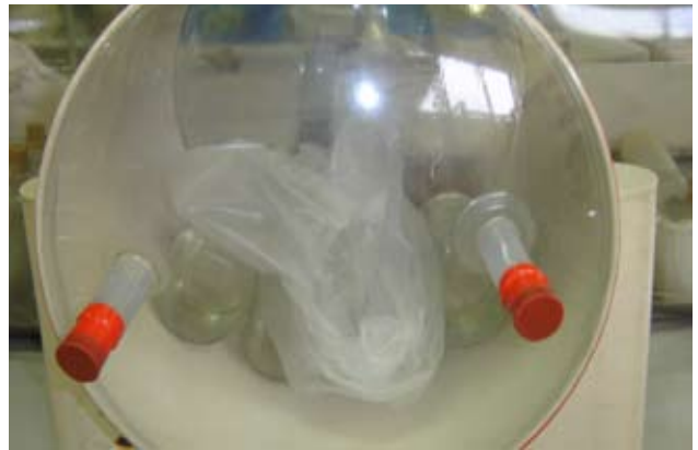
Fig. 2. Túnel de acceso.