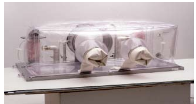
Fig. 3. Aislador flexible.