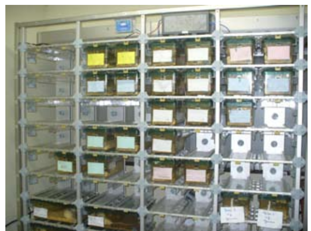
Fig. 5. ECIV - rack ventilado.