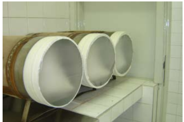
Fig.4 Cilindro porta insumos.