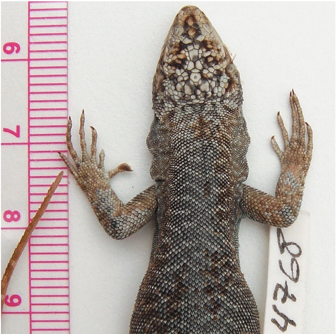
Fig. 1. Extremidades anteriores en un juvenil de Liolaemus petrophilus que presenta polidactilia.

Agradecemos la colaboración de Néstor Basso por el manejo gráfico. Los trabajos de campo fueron posibles por los subsidios de los proyectos NSF PIRE (OISE 0530267) y FONCYT-PICT 06-00506.