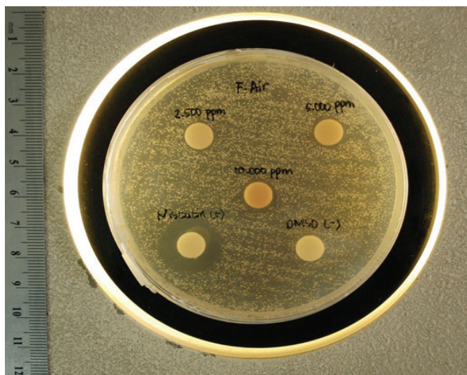
Gambar 1 Uji Daya Hambat Fraksi Air terhadap C. albicans

kedua, dan ketiga, kemudian diteteskan 50 µL nistatin dengan konsentrasi 50 µg/mL ke dalam cakram kertas keempat sebagai kontrol atau pembandingan. Cakram kertas kelima ditetesi cairan pelarut DMSO. Tiap-tiap cakram kertas diletakkan pada permukaan medium agar yang selanjutnya diinkubasi pada temperatur 37°C selama 24 jam. Uji ini dilakukan secara duplo. Diameter daerah hambatan diukur dengan cara menghitung diameter daerah hambat dikurangi diameter cakram. 9