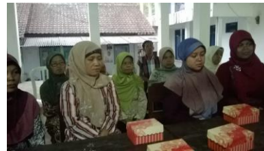
Gambar 7. Ibu-ibu pelatihan manajemen usaha dan keuangan