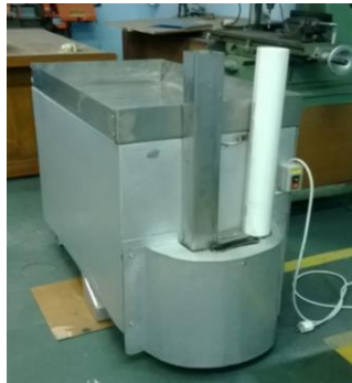
Gambar 2. Bentuk mesin pengiris bahan keripik

Bentuk mesin adalah seperti gambar 2. Dengan corong hantaran bahan keripik yang tinggi diharapkan akan memberikan tekanan secara gravitasi, sehingga dalam proses pengirisan yang membutuhkan tekanan kebawah bisa berjalan dengan sendirinya.