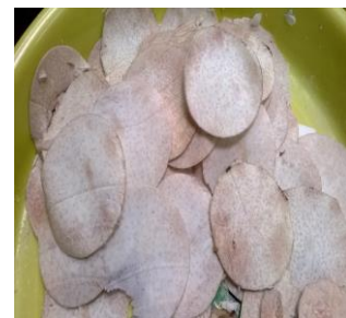
Gambar 4. Hasil pengirisan, bahan ketela pohon, keladi, dan pisang melakukan uji coba