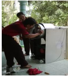
Gambar 6. Pelatihan maintenance dan keamanan penggunaan