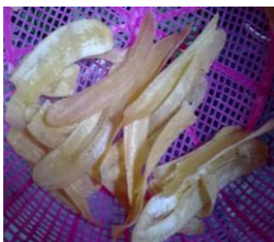
Gambar 3. Rekanan