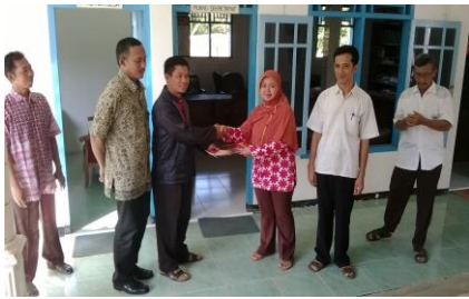
Gambar 5. Serah terima mesin