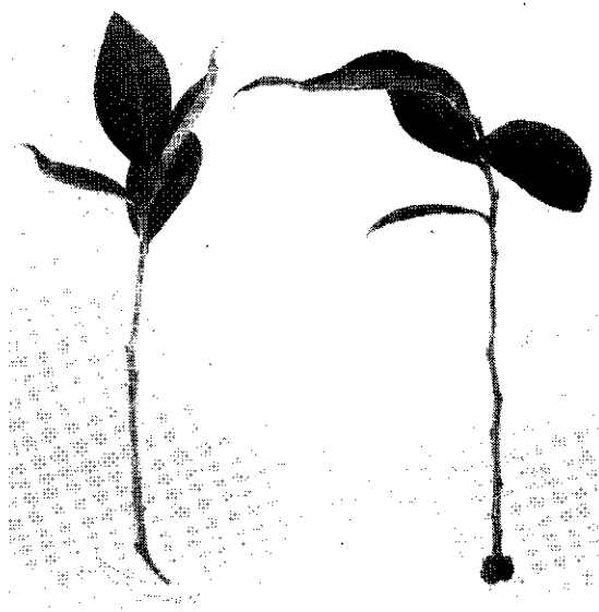
Stekken met hiel en callus

Van het gebruik van topscheuten, zoals dat in de publikatie van het Proefstation voor de Boomkwekerij is vermeld [1], is blijkens de ervaring in het afgelopen seizoen minder succes te verwachten (althans bij deze laatste Amerikaanse kruisingen) dan van de toepassing van korte, afgerijpte zijscheuten (veren). Bij verschillende gewassen geeft trouwens het korte, gedrongen stek de beste resultaten. Ook het aanbrengen van een verwonding kon geen voordeel brengen ten opzichte van de stekken met hiel. Wat de tijd van het stekken betreft, menen wij er beter aan te doen geen bepaalde maand te noemen. Immers, bij de Ameri-