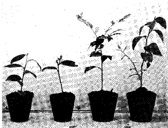
Scheutstek. Links: normaal, rechts: gedreven hout