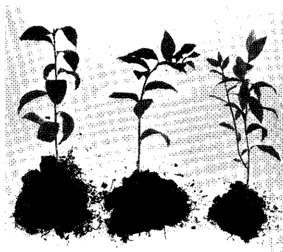
Stanley. Scheutstek van gedreven hout (watervernevelling)

Bij deze proef werd volledig succes geboekt. Bij de opzet werd uitgegaan van struiken, die op 21 februari 1958 uit het veld werden opgestoken, in grote potten werden opgepot en in een koud warehousen werden opgesteld. Daardoor begonnen