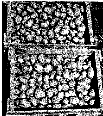
FIG. 2. Resultaat behandeling met CS_2 ; stimulering van de kieming. Gewas loofgetrokken midden november; geroid eind november; eind december behandeld met CS_2 ; foto genomen 12 januari. (voorste kist onbehandeld)