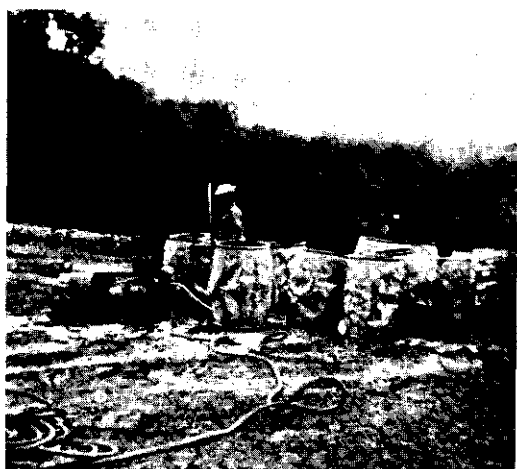
FIG. 7. Klaarmaken en wegpompen van de spuitvloeistof voor de bestrijding van Phytophthora en Alternaria