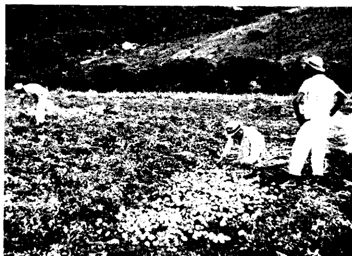
FIG. 10. Oprapen en sorteren van aardappelen (omgeving Bragança)