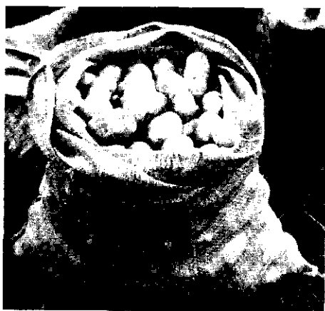
FIG. 11. Resultaat is niet slecht