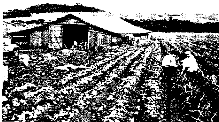
FIG. 12. Op voorraadgeroide aardappelen (omgeving Ponta Crossa)