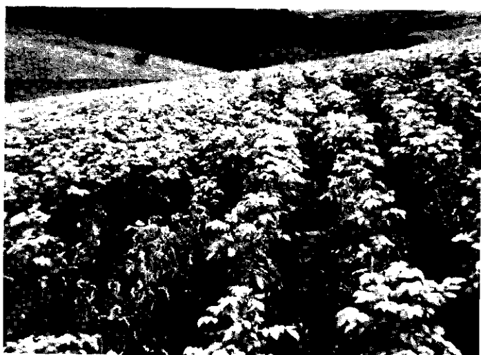
FIG. 9. Aantasting van de slimziekte in een jong gewas. Op dit veld is slechts één maal eerder aardappelen geteeld.