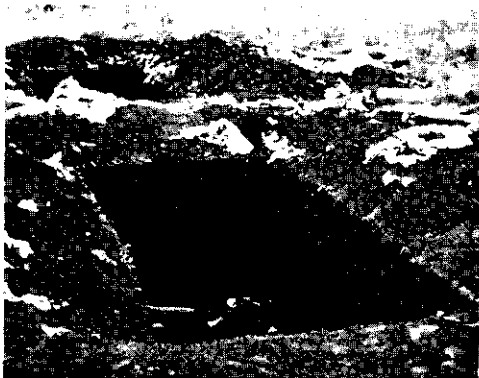
FIG. 3. Een kuil in de grond waarin men de behandeling met CS_2 wel toepast. (o.a. partij op foto 2)