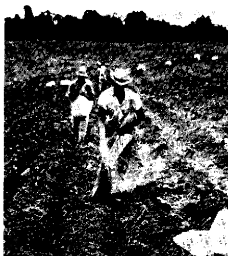
FIG. 4. Strooien van mengmest in machinaal getrokken geulen. Dit veld was een oude koffieaanplant; nu voor de eerste maal aardappelen (omgeving Bragança).