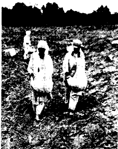
FIG. 5. Poten van aardappelen (omgeving Bragança).