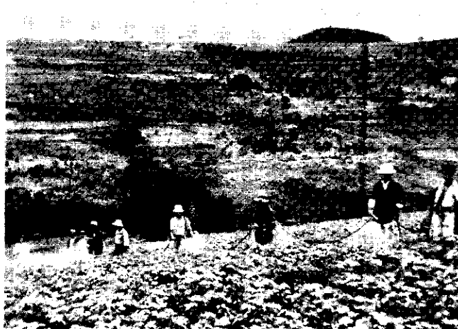
FIG. 8. Het uitvoeren van de bespuitingen (omgeving Bragança).