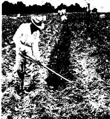
FIG. 6. Dicht maken van de geulen en het maken van een rug met de hak (omgeving Bragança)