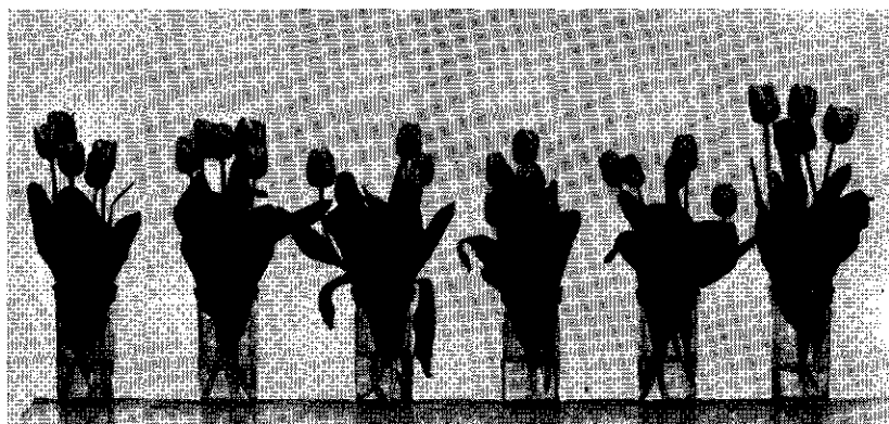
Foto 2 'Pandion', effect van radioactieve bestraling; van links naar rechts: dosis 20, 40, 60, 80 en 100 KR (kilo-röntgen). Rechts: controle. De foto werd genomen op het moment dat de bloemen, die de grootste dosis hadden gekregen, begonnen te verdrogen.