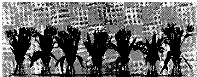
Foto 1 'Edith Eddy', effect van de remstof B-9 in water; concentratie van links naar rechts: 1, 2, 4, 6, 8 en 10%. Rechts: controle. De foto werd genomen 3 dagen na toediening van de remstof.

Anderzijds werd getracht de houdbaarheid te vergroten door het energieverbruik en daarmee de ontwikkeling af te remmen. Dit werd geprobeerd met de remstof B-9 (N-dimethylaminosucciamidezuur). Toevoeging van deze stof aan het water had wel een verminderde uitgroei tot gevolg, maar de