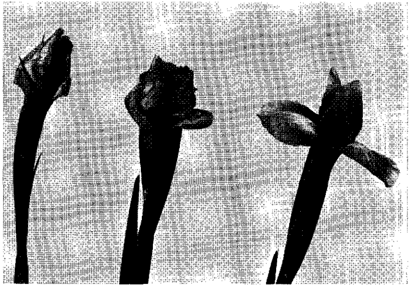
Foto 16 Bloemverdroging bij irissen in een zeer laat groeistadium.

peratuurbehandeling te geven kunnen 3-bladers geheel worden voorkomen. Dit is niet het geval met bloemverdroging; ook na een juiste bolbehandeling kan deze afwijking gemakkelijk ontstaan. Het zijn hier de omstandigheden na het planten en tijdens de groei die zeer belangrijk zijn. Kortom,