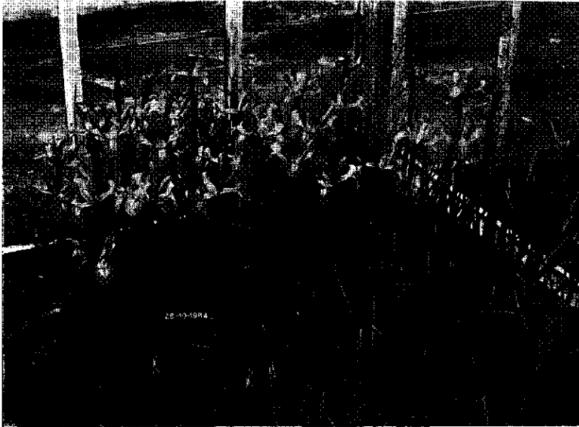
Foto 19 Bloei in oktober van geremde iris cv. 'Wedgwood'.

(remming) volgt een behandeling gedurende 4 of 6 weken bij 17° C. Bij deze temperatuur wordt de bloemvorming ingeleid. Bollen met een nabehandeling van 6 weken zullen eerder bloeien dan die met een nabehandeling van 4 weken bij 17° C. Wanneer de bollen tegelijk worden geplant kan een goede bloeispreiding worden verkregen. De iris moet van maart tot april buiten worden geplant en zal dan, afhankelijk van de cultivar, van juni tot augustus buiten bloeien. Alle voor remming geschikte cultivars kunnen voor bloei in deze periode worden gebruikt. Deze zijn: 'Wedgwood', 'Wedgwood Ideal', 'Dominator', 'Prof. Blaauw', 'White Excelsior', 'White Superior', 'H. C. van Vliet', 'White van Vliet', 'Imperator', 'Blue Giant', 'Saxe Blue' en 'Marquette'. Onder normale omstandigheden zal de tijd die verloopt tussen planten en bloei voor de 3 eerstgenoemde cultivars ongeveer 3 maanden en voor de andere cultivars ca. 4 maanden bedragen.