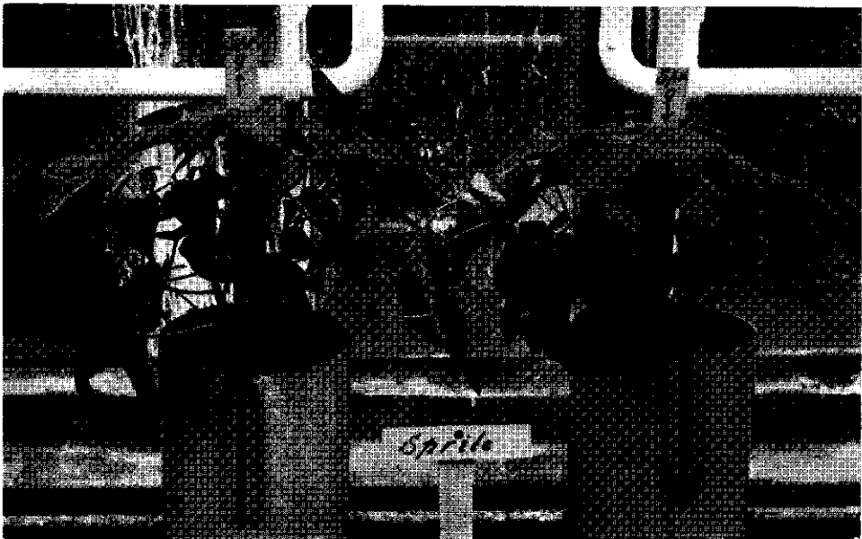
Fig. 4. The little susceptible variety Sprite, treated with 9 kg Ivorin per ha. Left: upward water movement; right: downward water movement.

niet of minder, wanneer zo'n ras wordt geteeld op opdrachtige grond, waar geen neerslag van betekenis valt in de eerste weken na de behandeling met Ivorin.