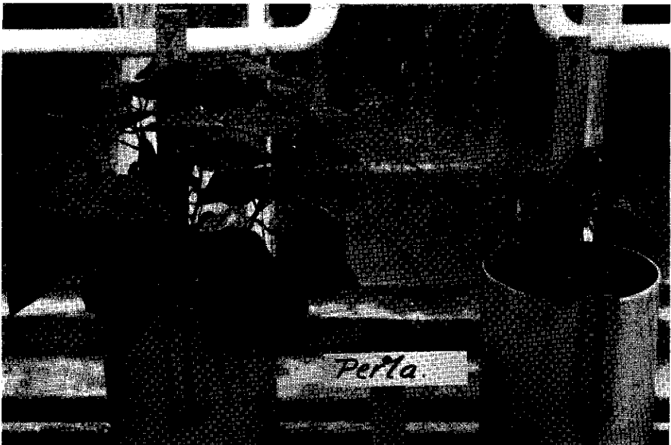
Fig. 3. The susceptible variety Perla, treated with 9 kg of Ivorin per ha. Left: upward water movement; right: downward water movement.