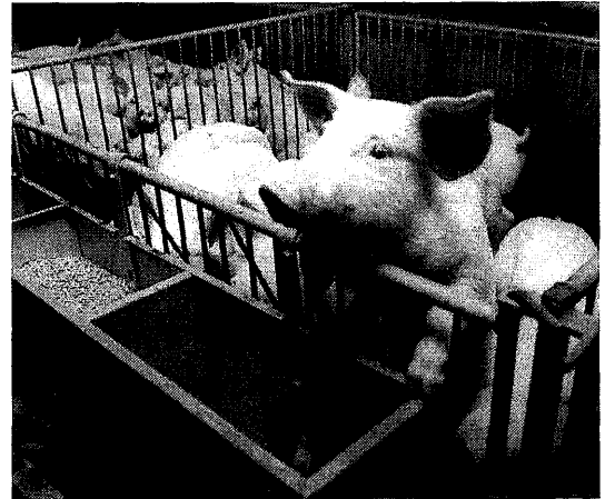
Continu speenkorrel voeren is erg duur

Speenkorrel/babybiggenkorrel beste systeem Het voeren van babybiggenmeel in plaats van babybiggenkorrel leidt tot een financieel nadeel van f 0,63 per afgeleverde big. Korrels verdienen dan ook de voorkeur boven meel. Het voeren van speenkorrel tot aan het einde van de opfokperiode is niet aan te raden vanwege de hoge prijs van dit voer. Het systeem waarbij rond het spenen speenkorrel wordt verstrekt en daarna babybiggenkorrel blijkt het beste te voldoen van de onderzochte systemen.