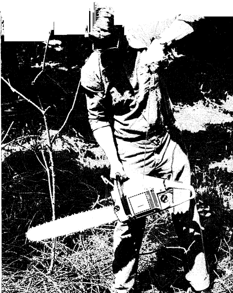
■ Van alle onderzochte vellingarbeiders start 70% de motorzaag door deze ongecontroleerd van zich af te werpen. Vroeg of laat kan dit tot ongelukken leiden.

★ Controle op naleving van de ARBOWet door de Arbeidsinspectie