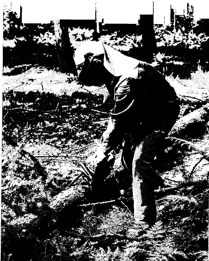
■ Slechts 22% van de onderzochte vellingsarbeiders snoeit volgens de veilige en ergonomisch aantrekkelijke "Zweedse snoeimethode".

deraannemers (ook bij verkoop van hout op stam);