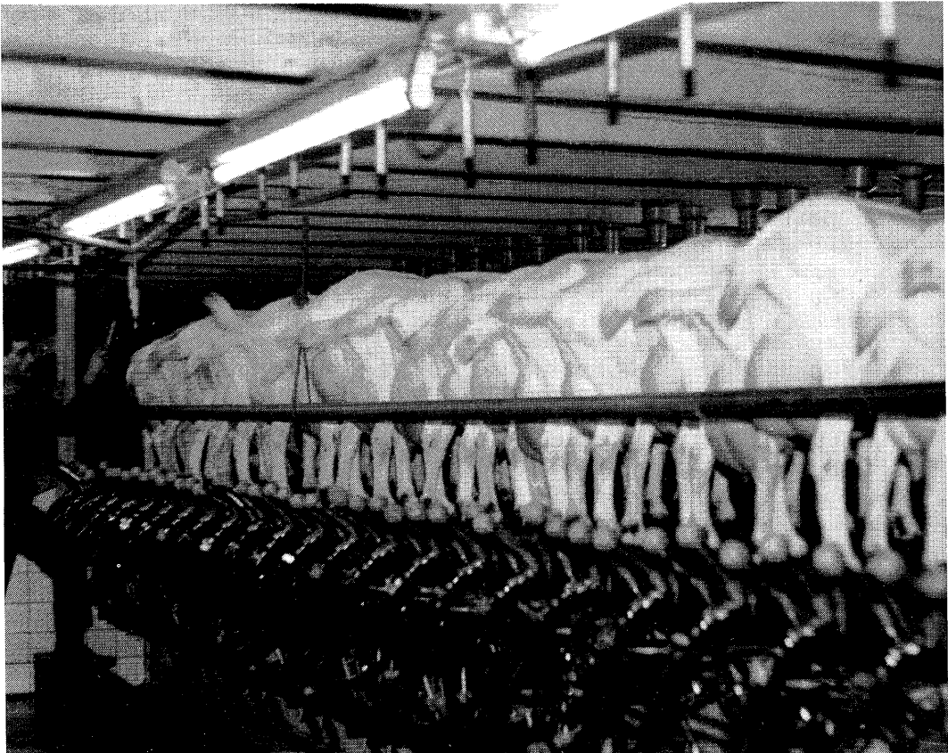
Hoge capaciteit mogelijk bij grote melkstallen en een goede werkorganisatie.

Aangezien er geen basisgegevens vanuit de praktijk bekend waren, zijn deze verzameld op een twintigtal bedrijven in midden Nederland. De gemiddelde machinemelktijd, de benodigde tijd voor de voorbehandeling, het aansluiten en afnemen van het melkstel, krachtvoerverstrekking en het wisselen van de geiten in de melkstal waren punten van onderzoek.