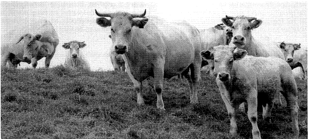
Charolais is gekozen omdat de dieren door hun grote voeropname-capaciteit geschikt zijn voor schrale graslanden.

Zoogkoeienhouderij op natuurgrasland in natte veenweidegebieden lijkt bedrijfseconomisch levensvatbaar vanaf een vergoeding van f 450 per ha waarbij grond- en pachtkosten op nul gesteld zijn. Dit bij de gegeven omvang van 330 ha en de gekozen bedrijfsopzet (variant 3). Omdat de bedrijfsvoering van deze variant voldoet aan de ECO-normen, zou men door aansluiting bij het ECO-circuit een hogere vleesprijs als uitgangspunt kunnen nemen. Dit betekent dat de berekende vergoeding kan vervallen. De vergoeding betekent dat zowel de ondernemer als het ingebrachte bedrijfskapitaal een passende vergoeding ontvangen. Voorgaande berekeningen bieden boeren een handvat in de onderhandelingen over de grond- en pachtkosten en de eventueel vereiste beheersvergoeding betreffende gronden in de ecologische hoofdstructuur. Echter gezien de vereiste omvang van het bedrijf, lijkt zoogkoeienhouderij eerder geschikt voor organisaties als Natuurmonumenten, Staatsbosbeheer of Provinciale landschappen.