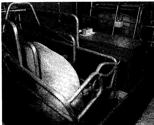
Huweca-box, Inter Continental

In dit kraamhok staat een Huweca-box. Dit is een box die smal is als de zeug staat. Zodra de zeug gaat liggen duwt zij de onderste buis, met tegendruk van een cilinder, naar buiten, zodat de box breed wordt en het uier goed bereikbaar is. Ter voorkoming van doodliggen is een biggenblazer aangebracht. De vloer onder de zeug is gedeeltelijk een kunststofrooster (polyrooster), en gedeeltelijk dichte kunststof vloer. De biggennesten aan weerszijden van de zeug liggen 2 cm lager dan de vloer onder de zeug. Deze rand dient ter beperking van doodliggen. Bovendien zorgt de rand voor een afscheiding van het biggennest. De biggennesten zijn voor een deel verwarmde polyester-betonnen platen (0,4 x 1,1 m) en gedeeltelijk kunststof biggenrooster.