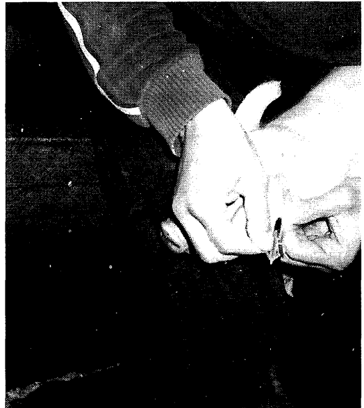
Bloed afnemen bij de big met behulp van de Translet