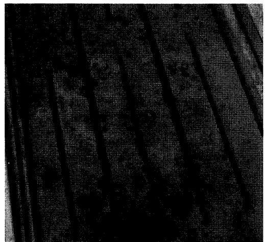
Betonroosters hebben een slechte invloed op de klauwen

Vochtigheid is akankelijk van het vloertype en het stalklimaat. Het seizoen kan via deze weg ook van invloed zijn op de klauwgezondheid. ►