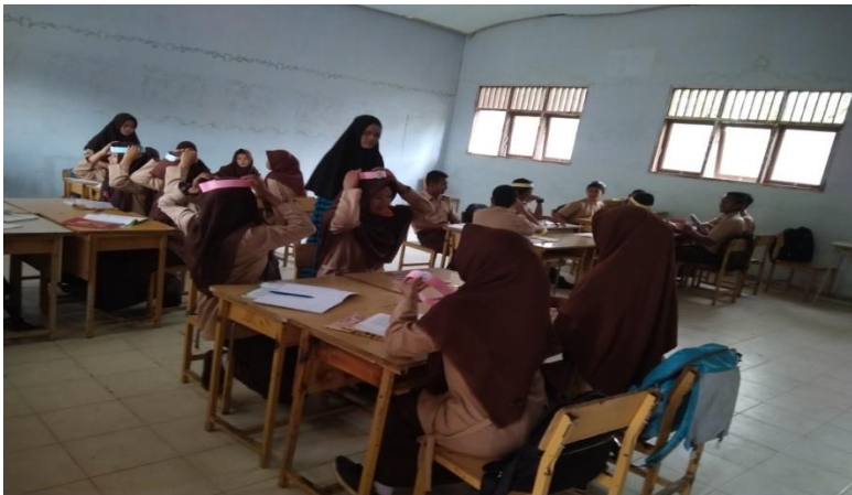
Gambar 4: Siswa duduk berkelompok