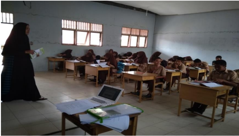
Gambar 1: Guru menyampaikan Apersepsi