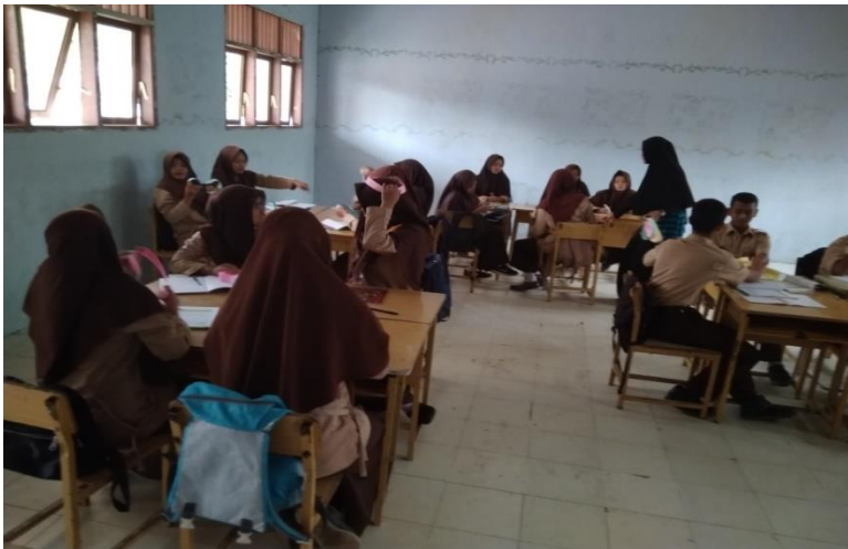
Gambar 6 : Siswa mengerjakan LKS