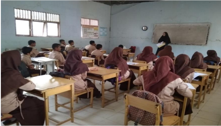
Gambar 3: Guru menjelaskan Materi Pelajaran