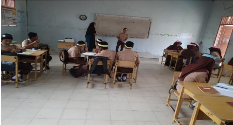
Gambar 7: Nomor yang ditunjuk memaparkan hasil diskusi kelompoknya