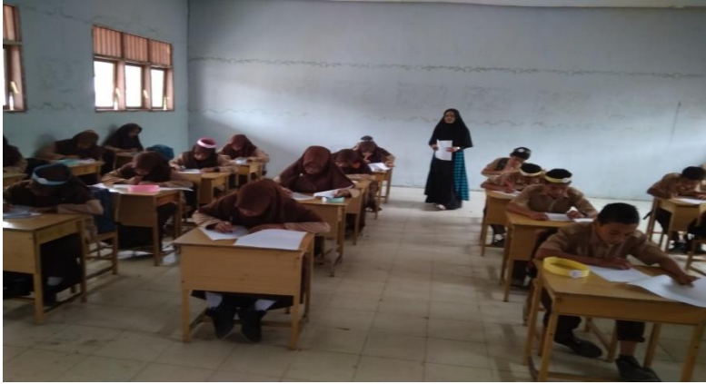
Gambar 9: Evaluasi, pembelajaran berakhir