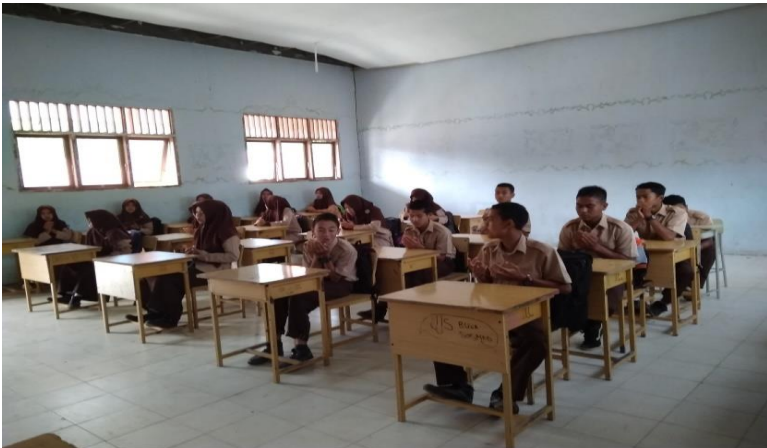
Gambar 2 : Guru memotivasi siswa