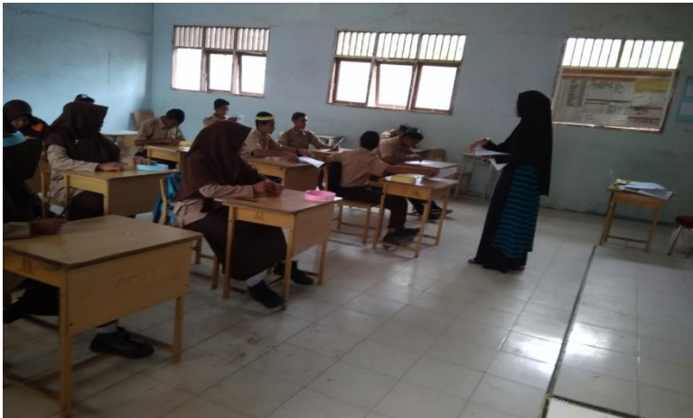
Gambar 8: Guru membagikan soal evaluasi