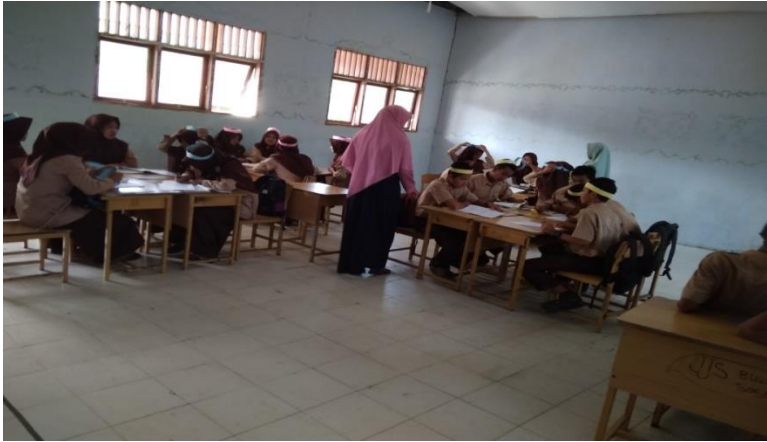
Gambar 5: Guru membagikan LKS