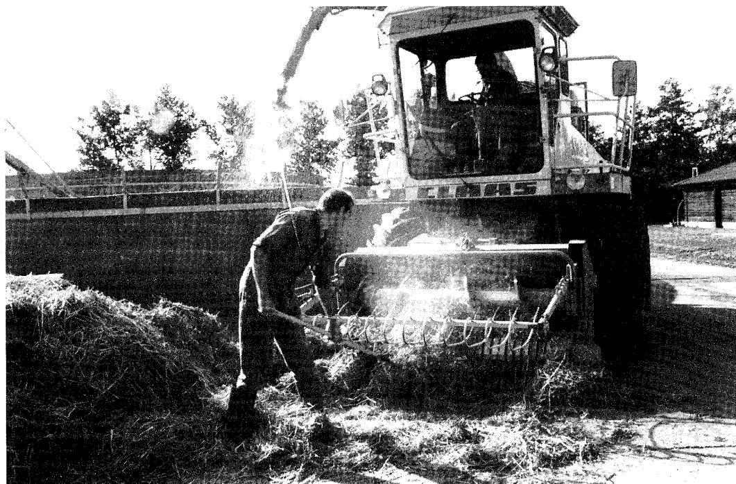
Bij deze methode van stro toevoegen is een tweede persoon nodig voor het invoeren van het stro in de hakselaar.

In de proeven is aan de mengmest in de silos 4 kg stro per m 2 silo-oppervlak toegevoegd. Het stro is met een zelfrijdende hakselaar gehakseld en in de silo geblazen. Dit is gedaan op het moment dat voldoende mest in de silo aanwezig is om met het stro gemengd te kunnen worden. In