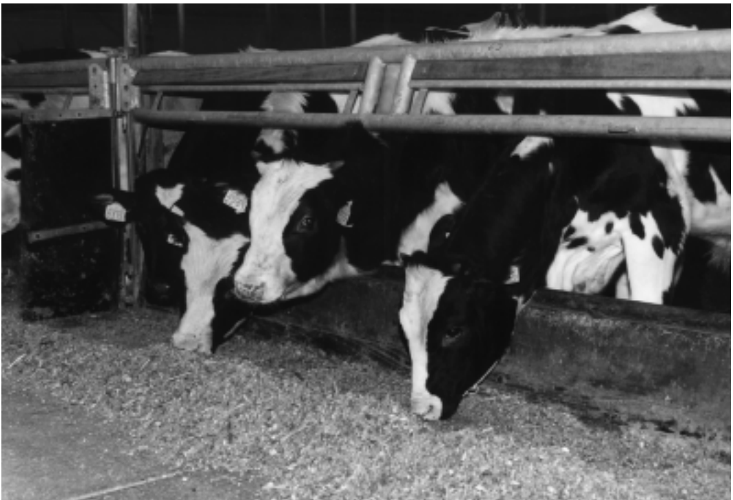
Suikers en goed verteerbare ruwe celstof zijn geschikte energiesoorten voor roze-vleeskalveren.