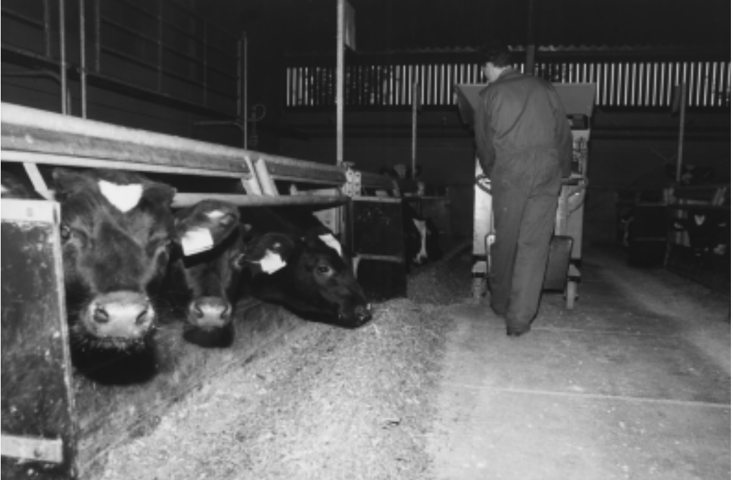
De kalveren werden één keer per dag gevoerd met een voermengwagen.

produkten als bieten- en citruspulp. In dit onderzoek lag de prijs van krachtvoer B met het hoge (bestendig-) zetmeelgehalte gemiddeld een gulden per honderd kg hoger dan de prijs van krachtvoer A. Omdat er geen verschil was in technische resultaten was de kostprijs van de kalveren die krachtvoer met een hoog (bestendig) zetmeelgehalte kregen bijna 4 cent per kg karkas hoger.