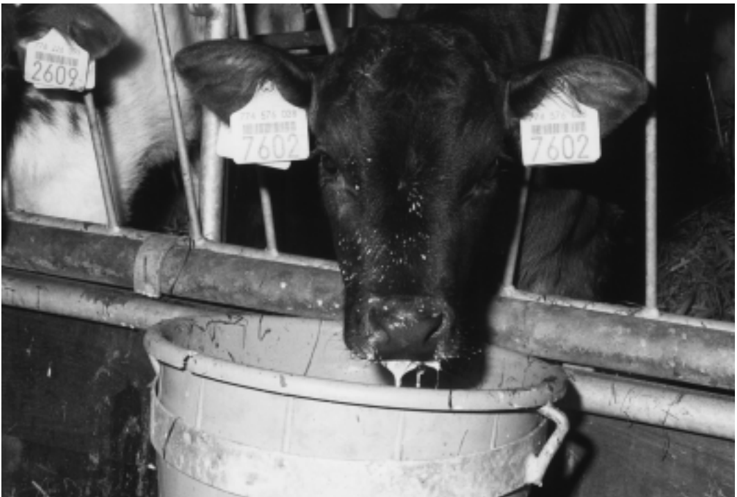
De eerste zeven dagen werden de kalveren preventief behandeld tegen een salmonella-infectie met een antibioticum in de melk.

Bij de proefopzet is rekening gehouden met de proef tijdens de opfok gericht op verschillende