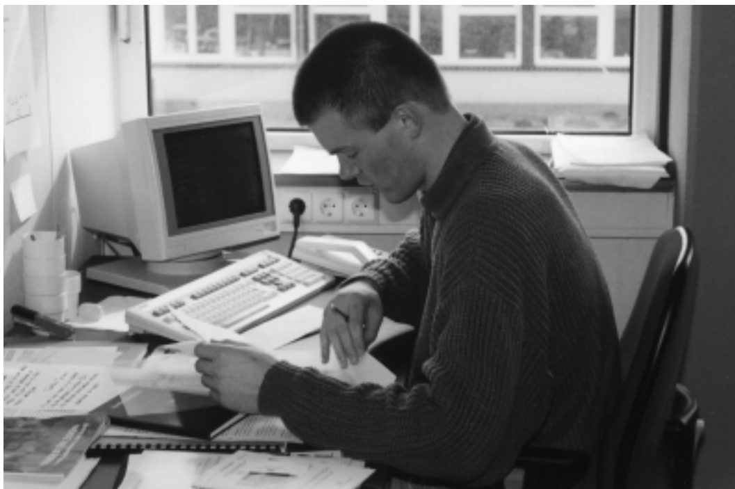
De gegevens zijn met het statistisch pakket Genstat 5 verwerkt.

Bij de resultaten wordt de sed vermeld. De sed is de 'standaard fout van het verschil'. Verschillen tussen behandelingen zijn significant ( P < 0,05 ) als het verschil groter is dan twee maal de sed.