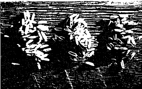
Drie soorten ongekookte rijst, van links naar rechts: witte rijst, parboiled rijst en zilvervliesrijst