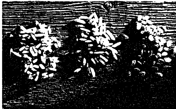
Van links naar rechts: gebroken rijst, langkorrelige rijst en rondkorrelige rijst; alle ongekookt