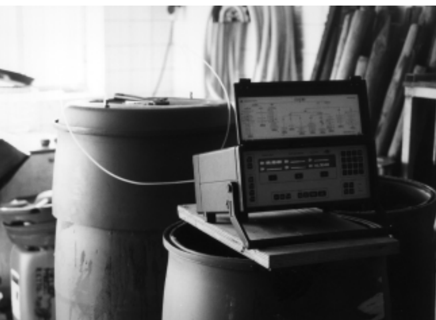
Figuur 2 NH 3 -concentraties boven de mest

De concentraties zijn gemeten met een gas-analyser (B&K) in een luchtdicht afgesloten vat.