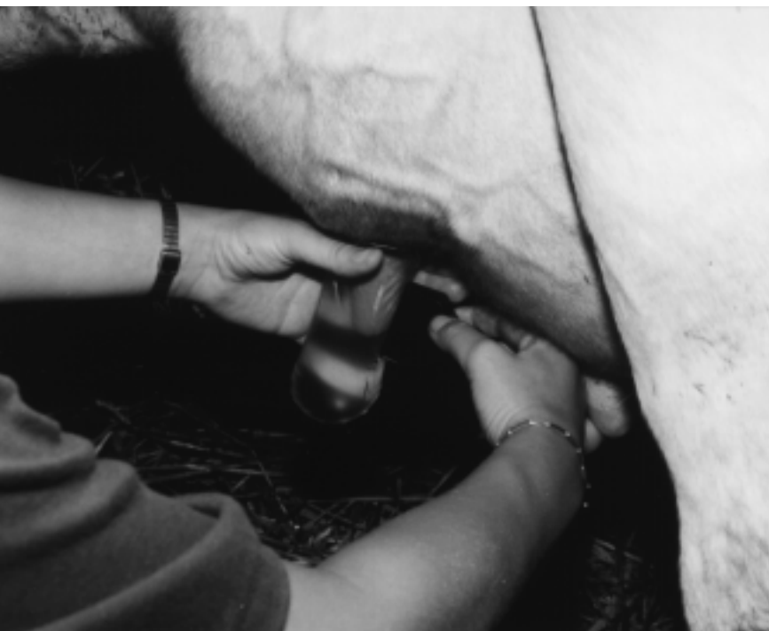
De scanner meet snel de speen.

meten. Het lactatienummer van de koeien varieerde van 1 tot 8, zij waren 21 tot 300 dagen in lactatie en gaven tijdens de betreffende ochtendmelking 3 tot 20 kg. De melktijd varieerde van 4 tot 12 minuten.