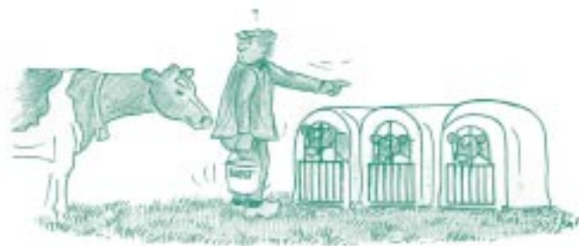
Alleen biest van de eigen moeder aan het kalf geven en daarna kunstmelk.

Biest en melk kunnen in de koe al besmet zijn met de paratbc bacterie. Om verspreiding zoveel mogelijk te voorkomen dient een vaarskalf alleen biest te krijgen van de eigen moeder