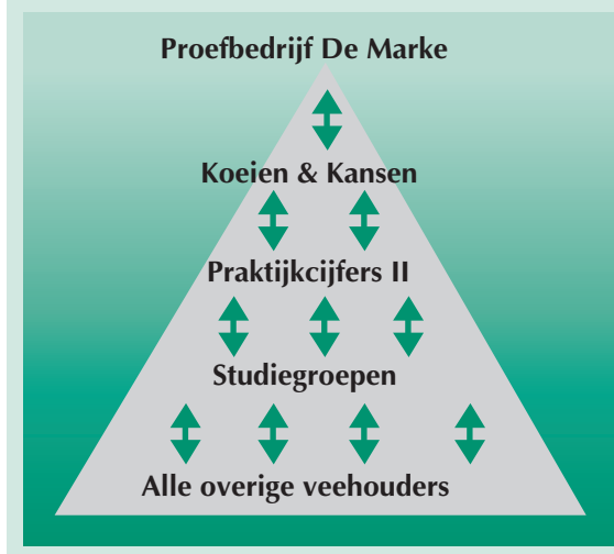
Figuur 2 Kennisuitwisseling logisch bekeken

Praktijkcijfers II. De samenwerking richt zich vooral op de kennisoverdracht van en naar de brede melkveehouderij (figuur 2).