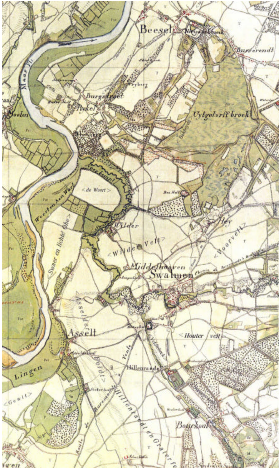
Figuur 1 Tranchotkaart Swalmdal (1803/04)