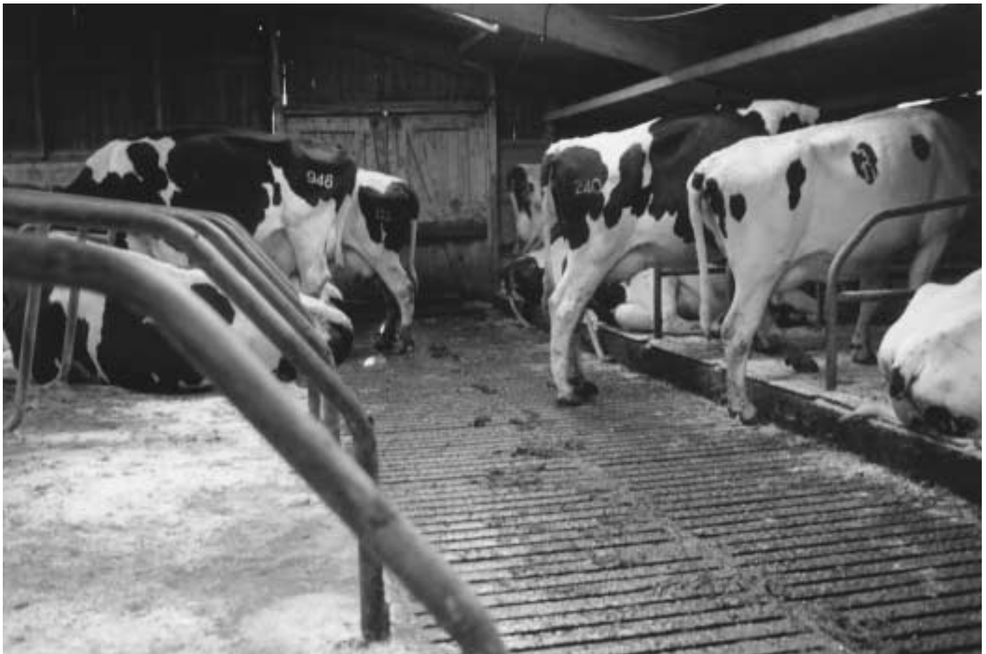
Op stalen roosters is de klauwgezondheid niet slechter dan op betonroosters.

Meer informatie over stalen roosters is te vinden in Publicatie 110: Reductie ammoniakemissie door stalen roostervloeren.