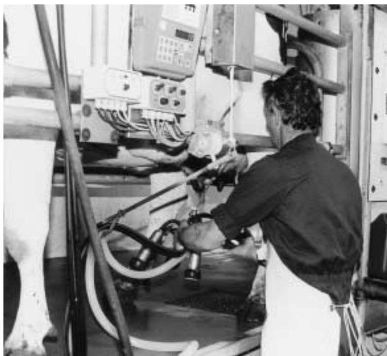
Een lagere stikstofbemesting kan de melkgift per koe drukken.