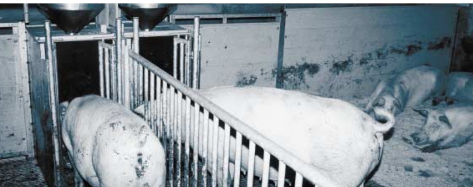
Onbeperkt gevoerde drachtige zeugen met I.V.O.G.-voerstation

De ammoniakemissiemetingen zijn uitgevoerd in augustus 1999 (de zomerronde) en september 1999 (de winterperiode).