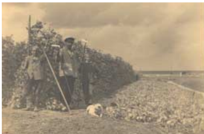
Zaadteelt van bonen rond 1935 nabij Enkhuizen.

In de praktijk is het vaak gokken of een partij zaad de 'standaard' fysieke behandeling doorstaat. Uitproberen van verschillende sterktes van behandelingen kost veel tijd (weken), zeker als het effect middels kiemtoetsen geanalyseerd moet worden. Deze verschillen tussen zaadpartijen in gevoeligheid voor fysische behandelingen zijn in het algemeen sterker dan bij gebruik van synthetische middelen voor ontsmettingen. Er is behoefte aan snelle analysemethoden die de mate van gevoeligheid van uitgangsmateriaal voor beschikbare en alternatieve ontsmettingsmethoden kunnen vaststellen. Daarnaast is er een grote behoefte aan ontwikkeling van alternatieve ontsmettingsmethoden die de ziekteverwekker effectief onderdrukken of elimineren, maar die de kiemkracht van zaad, bol of knol niet aantasten. Dergelijke alternatieven liggen mogelijk ook in de toepassing van plantversterkende middelen, behandelingen die de eigen weerstand van de jonge plant verhogen en daarmee de groei of activiteit van de pathogenen onderdrukken.