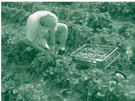
De resultaten van de biologische aardbeiteelt in Meterik zijn hoopgevend: In de normaalteelt worden opbrengsten van 12 ton per ha gerealiseerd

De opbrengst van biologische Chinese kool is vergelijkbaar met de opbrengst van de geïntegreerde teelt. De kwaliteit, uitgedrukt in kolen zwaarder dan 800 gram is een stuk lager. Opnieuw zijn ziekten ( Alternaria ) en plagen (rups) de oorzaak van dit kwaliteitsverlies, dat met name in de latere teelten optreedt. Door toenemende problemen met knolvoet neemt de opbrengst door de jaren heen sterk af, omdat steeds meer planten uitvallen. Omdat dit probleem ieder jaar ernstiger wordt, kan de teelt van Chinese kool wellicht geheel verdwijnen uit het teeltsysteem. Voor Chinese kool geldt ook dat alleen gezonde kolen worden geoogst, zodat de geoogste hoeveelheid afneemt bij sterkere aantasting door ziekten en plagen.