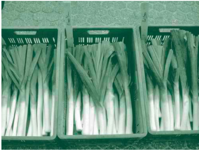
De kwaliteit van biologische prei heeft te lijden onder diverse aantastingen. In Meterik worden diverse rassen vergeleken op prestaties voor productie en kwaliteit in de biologische teelt

type gewassen relatief laag. Er zijn geen synthetische pesticiden of pesticiden van natuurlijke oorsprong ingezet, waardoor ook geen milieurisico's ontstaan. Bij het thema duurzaam beheer productiemiddelen ligt de fosfaat bodemreserve ver boven de streefwaarde, als gevolg van de voorgeschiedenis van dit perceel. Een snelle verlaging is op korte termijn niet mogelijk. Door het lage fosfaatoverschot wordt verdere groei van de bodemreserves voorkomen. Het aantal uren handwieden op bedrijfsniveau ligt met 33 uur/ha nog iets te hoog. Voor een voldoende bedrijfscontinuïteit in de toekomst zal deze arbeidsinzet verder verlaagd moeten worden. In figuur 1 en tabel 1 worden de resultaten van het biologisch bedrijf (1997 tot en met 2000) weergegeven.