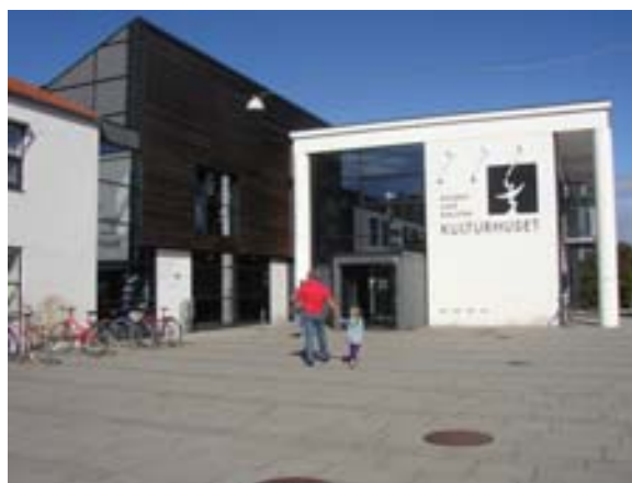
Afbeelding 3. Kulturhus in Skanderborg, Denemarken.

Op Flevoland na heeft elke provincie van Nederland beleid ten aanzien van gemeenschapsaccommodaties of dorpshuizen. Tien van deze provincies ontwikkelen nieuwe formules op