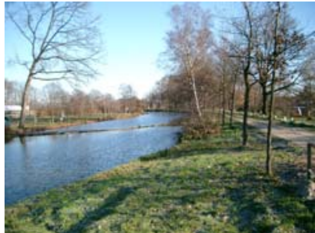
Afbeelding 4. Wilhelminakanaal bij Haghorst.

De selectie van de cases is in samenwerking met LCO Zwolle gemaakt. Hierbij is getracht om de zes typen gemeenschapsaccommodaties allemaal minstens eenmaal te selecteren. Tevens is er geprobeerd om de cases te selecteren uit dorpen met minder dan 2000 inwoners. Het Kulturhus in Zwartsluis vormt hierop een uitzondering. De reden om Zwartsluis toch te betrekken in het onderzoek is gelegen in het feit dat het Kulturhus een uiting is van hedendaags beleid rondom gemeenschapsaccommodaties.