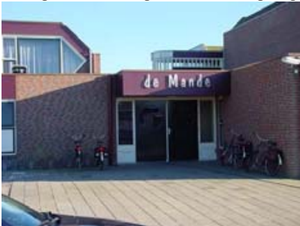
Afbeelding 5. Multifunctioneel centrum De Mande.

De financiering is een moeilijk punt. Toen er bijvoorbeeld tijdens de MKZ-crisis een jaarlijks feest niet door kon gaan betekende dit een aanzienlijke financiële strop voor de Mande. Men moest geld lenen van de gemeente om de begroting toch rond te krijgen. Dit geeft wel aan