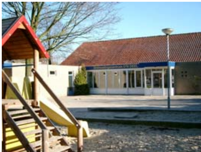
Afb. 6 Ontmoetingscentrum Den Deel

Bij de zaalverhuur zit dan geen drank, dit moeten de huurders zelf zien te regelen. Er is ook apparatuur om te koken aanwezig. Andere horecaondernemers in het dorp zijn niet blij met deze ontwikkeling en hebben zelfs geprotesteerd. De oude beheerder wilde dit dan ook niet doen om de horeca niet te beconcurreren.