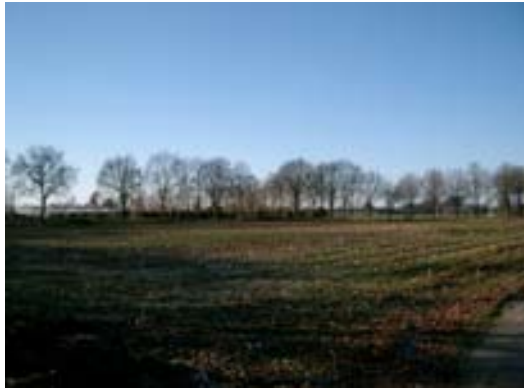
Afbeelding 2. Landelijk gebied rondom Haghorst

in Nederland vooral de laatste decennia sterk zijn verkleind in een voortgaand verstedelijingsproces. Er is een algemene trend van 'time-space compression' gaande. Dit houdt in dat tijd en afstand steeds geringere drempels voor interactie vormen. Rurale gebieden zijn daardoor in de laatste decennia steeds verder geïntegreerd geraakt in bredere geografische verbanden. Stedelijke en landelijke gebieden komen in een andere relatie tot elkaar te staan. Landelijke gebieden worden steeds meer als consumptieplaats gebruikt door stedelingen, terwijl traditionele, meer productieve functies, zoals de landbouw aan belang hebben ingeboet of worden vervangen door andere functies, zoals wonen, recreëren en natuurfuncties.