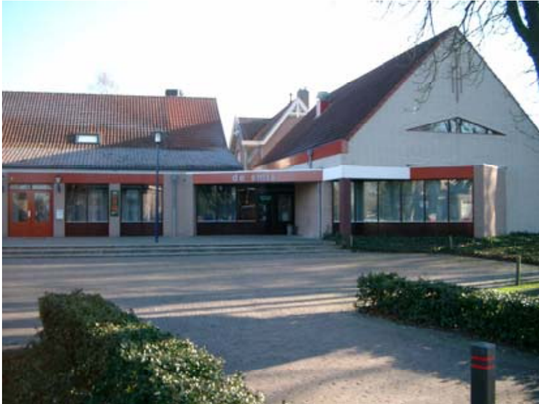
Afbeelding 1. Dorpshuis 'De Smis' in Duizel.