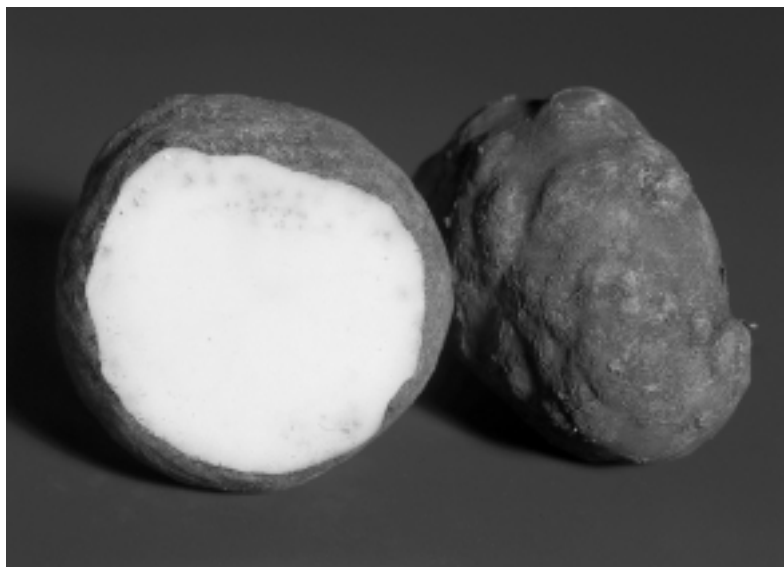
Aardappel met het maïswortelknobbelaaltje Meloidogyne chitwoodi .

maar dan bij veel lagere aaltjesdichtheden. Alleen door vroege detectie van besmettingshaarden en zorgvuldig afstemmen van rotatie en resistentie van aardappelrassen kan een snelle ontwikkeling van besmettingshaarden tot uniforme besmettingen worden voorkomen en kan het risico van detectie van aardappelcystenaaltjes in exportpartijen klein worden gehouden. Bij wortelknobbelaaltjes is de situatie waarschijnlijk anders. Deze aaltjes hebben een veel grotere waardplantenreeks dan aardappelcystenaaltjes, waardoor ze snel een bepaalde maximale dichtheid kunnen opbouwen. Ook zijn de maximale dichtheden die ze bereiken op vatbare gewassen gering, vergeleken met aardappelcystenaaltjes. Daarom kunnen vrij lage dichtheden wortelknobbelaaltjes snel hun maximale dichtheden bereiken en leiden tot min