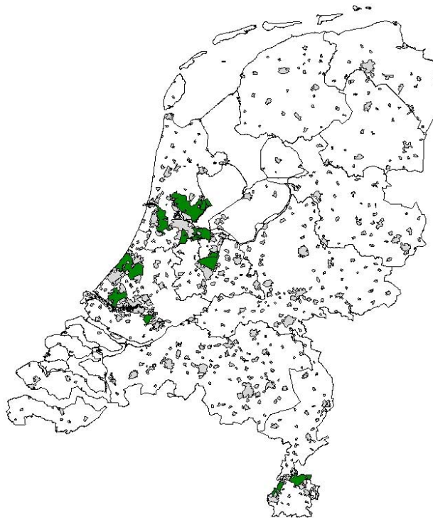
Figuur 2 De ligging van de tien Rijksbufferzones (Bervaes et al. 2001)