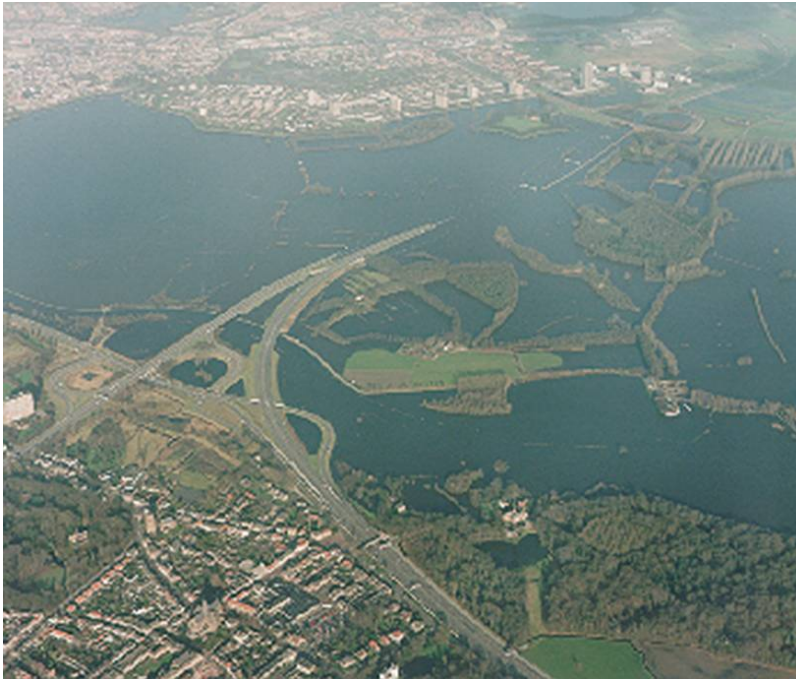
Figuur 5 De overstroming van het Bossche Broek in 1995.