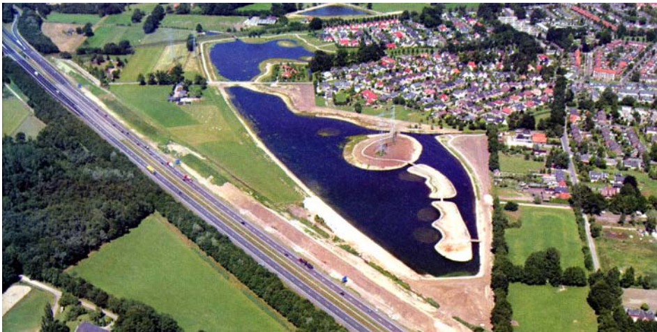
Figuur 7 De blauwe contour in de stedelijke randzone van Hengelo.