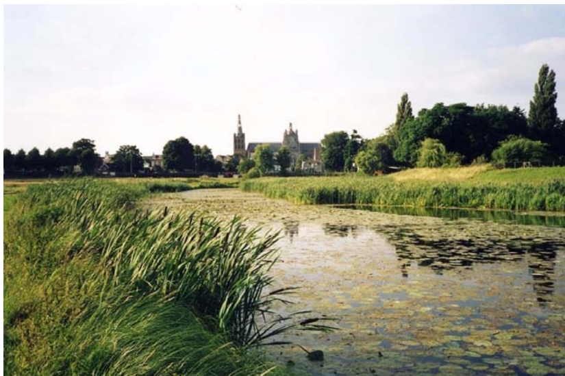
Figuur 6 De Sint Jan gezien vanuit het Bossche Broek

zuidelijk deel van de stad 's-Hertogenbosch. Het Bossche Broek heeft een waterbergingscapaciteit van 8 miljoen m 3 , waarvan 2/3 in het gebied ten noorden van de A2 geborgen kan worden. Dit is ook het gebied waar geen woningen staan en waar de meeste grond in handen is van beheerders van natuurterreinen en de gemeente. Aanvullend op de fysieke maatregelen is een beslissingsondersteunend computermodel opgezet, waaruit te zien valt wanneer het gebied ingezet moet worden. In 1998 is de besluit- en inspraakprocedure gestart. In 1999 werd het project afgesloten. Inclusief de uitvoering van de onderzoeken heeft het proces (vanaf de overstroming) ongeveer 4 jaar geduurd.