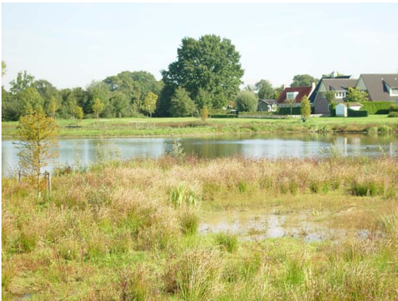
Figuur 8 Het Waterpark en de rand van de wijk 't Genseler

Over het resultaat van de genomen maatregelen is wat betreft effectiviteit van de bestrijding en de hoogwateroverlast en de verdroging nog weinig te zeggen, aangezien de maatregelen net uitgevoerd zijn. Wel is te zeggen dat er een bergingscapaciteit is gerealiseerd en dat die ook al gebruikt is. Bovendien is er een nieuw natuurgebied ontstaan en is er in het westen van Hengelo een nieuw park ontstaan.