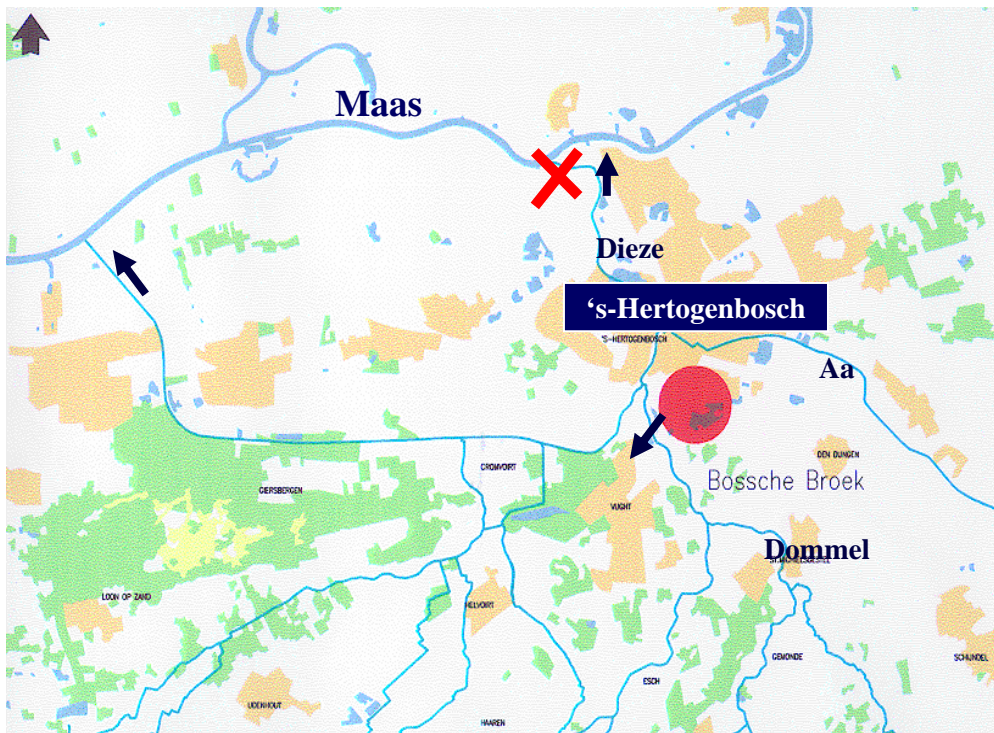
Figuur 4 Positionering Bossche Broek.

uit eerder onderzoek. Het gaat hierbij met name om manieren waarop de grond verkregen is.