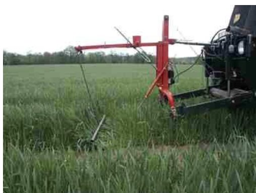
Figuur 4.3 De CROP-meter aan de voorzijde van een trekker.

De CROP-meter is ontwikkeld in Duitsland door ATB-Bornim in samenwerking met Mueller Elektronik. De CROP-meter beweegt door het gewas en is in staat een schatting te geven van de biomassa. De CROP-meter is geschikt voor alle gewassen met een verticale stengel.