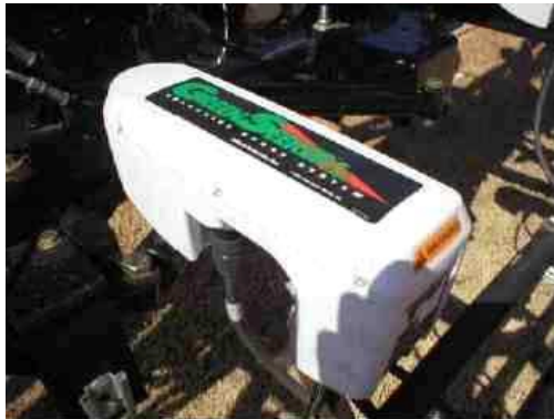
Figuur 4.1 De GreenSeeker aan een spuitboom .

Bij het bepalen van de hoeveelheid stikstof die moet worden bijbemest dient gebruik te worden gemaakt van een omgekeerd stikstofvenster. De NDVI van dit supra-optimaal bemeste object, het aantal dagen sinds opkomst, een schatting van de stikstofefficiency en een schatting van de opbrengstpotentiaal van het perceel worden gebruikt om de bemestingshoeveelheid te berekenen. Op dit moment zijn er alleen 'standaard' rekenregels beschikbaar voor tarwe. Er wordt gewerkt aan rekenregels voor mais, gerst, katoen en gras, maar ook rekenregels voor suikerbieten, aardappels staan op het programma (N-Tech, 2003).