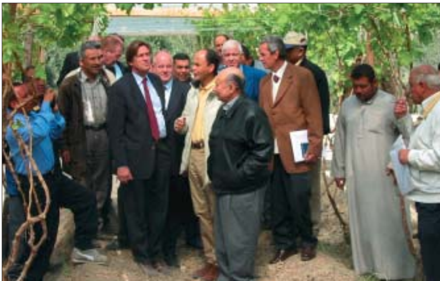
De delegatie op bezoek bij een druiventeler in Egypte.

alle Nederlandse landbouwgronden. Alle agrarische activiteiten zijn vrijwel volledig afhankelijk van het Nijlwater. Van oudsher is de Fayoom ten zuidwesten van Kairo de tuin van Egypte. Ook de Nijldelta hoort tot de oude tuinbouwgebieden. Het aantal bedrijven in deze gebieden is zeer talrijk maar kleinschalig en men produceert voor de thuismarkt. De laatste decennia is er een aantal nieuwe productiegebieden bijgekomen. Irrigatiewerken worden aangelegd in gebieden met geschikte woestijngronden, waardoor de teeltoppervlakte met ongeveer 50 % toenam, en komende decennia komt er een kwart bij. Kort aangeduid zijn het de volgende gebieden: