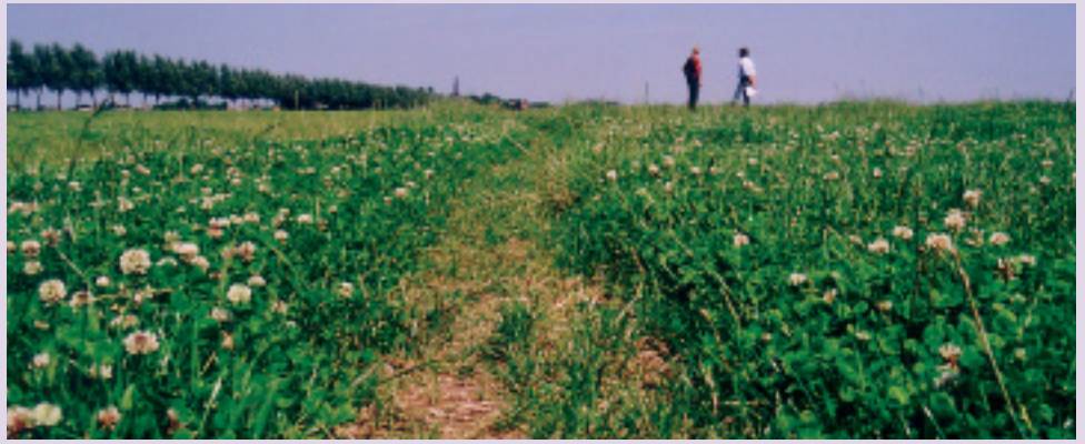
Voor een goede stikstofvoorziening is veertig tot vijftig procent klaver in het gras nodig

Scheuren van gras en opnieuw inzaaien met een mengsel van gras en klaver is de beste manier om te beginnen. Doorzaaien kan ook maar de slagingskans blijkt toch vrij klein. Of het goed gaat is vooral afhankelijk van het weer. Zit de klaver er eenmaal goed in dan zijn de