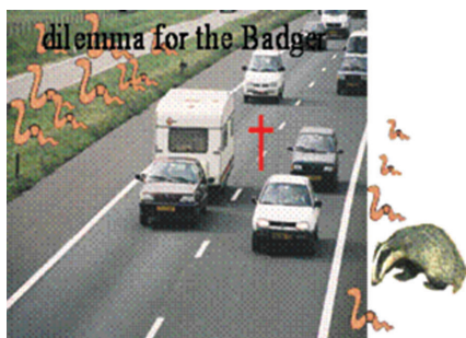
Figuur 2 Toename aantal verkeersslachtoffers mede als gevolg van bodemvervuiling

Met behulp van het populatiedynamische model PODYRAS is berekend dat bij kopergehalten rond de 100 mg/kg grond de populatiegroei van regenwormen al met 20 % kan afnemen (Klok et al. 1997). De afname in de beschikbaarheid van regenwormen voor de das is berekend met PODYRAS voor Cu gehalten welke voorkomen in Nederlandse bodem. Uit de modeluitkomsten blijkt dat in de leefgebieden het Reestdal en de Kempen deze beschikbaarheid met meer dan 10% kan afnemen, in de andere leefgebieden varieert deze afname tussen de 1 en 10%.