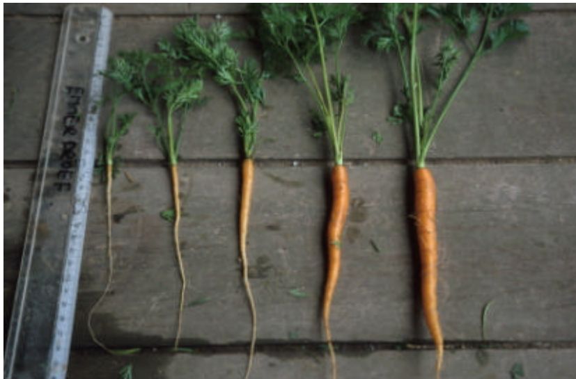
Figuur. Aanwezige gewasstadia van peen op 5 juni.

Op 5 juni werden geen verschillen in aantasting door de wortelvlieg aangetroffen (Tabel 18). Worteldikte varieerde van 0,5 tot 0,8 cm maar de verschillen waren niet betrouwbaar. Gemiddelde looflengte varieerde van 14 tot 17 cm en aantal bladeren per wortel varieerde van 5,2 tot 5,8. Ook hierbij waren de verschillen niet betrouwbaar.