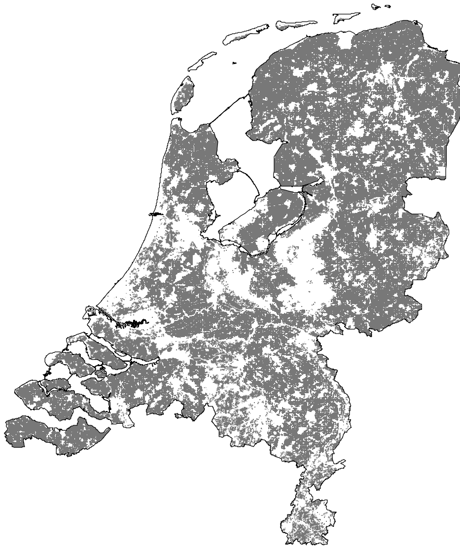
Figuur 2: Agrarisch gebied in Nederland.