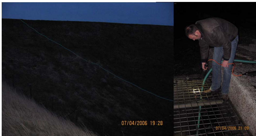
Figuur 4. Foto-Impressie van de drukpomphevel over de zeedijk bij de Prommelsluis.

meter. Aan de uitstroomopening van deze hevel werd een net bevestigd in de vorm van een sok waarin al het overgehevelde materiaal en vis wordt verzameld, vergelijkbaar met de vacuümpomphevel. Met een drukpomp werd de hevel gevuld met water uit de polder. Zodra de hevelbuis met water was gevuld, werd de pomp uitgeschakeld en ontkoppeld, waardoor de hevel in werking trad.