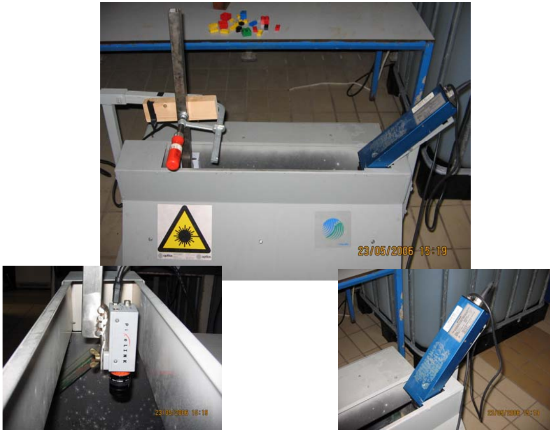
Figuur 7. Opstelling laser en camera.