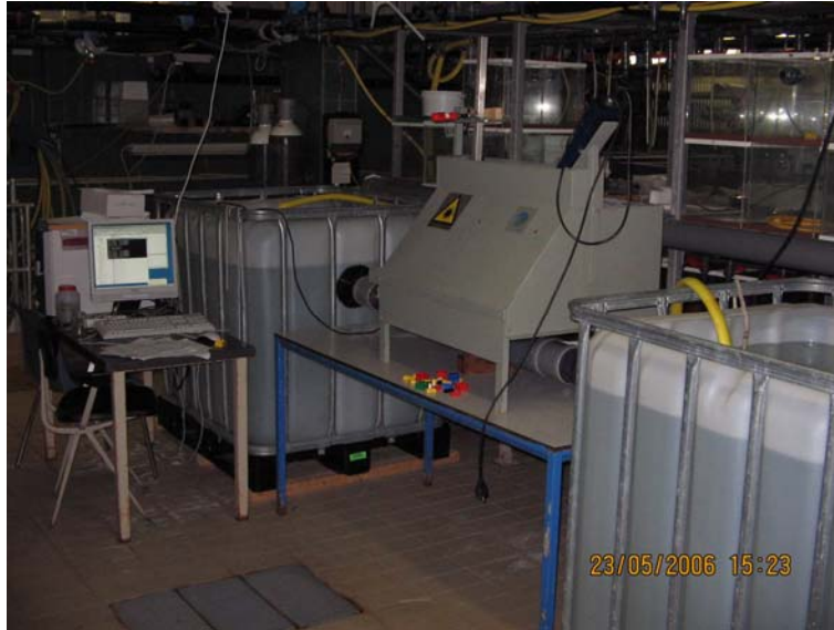
Figuur 5. Experimentele opstelling tel/herkenningsapparatuur.

onderscheiden van passerende glasaal ten opzichte van ander objecten doordat een expert aangeeft wat voor object passeerde. Nadat het netwerk de leercyclus met goed gevolg heeft doorstaan kan het gebruikt worden om in real time automatisch te bepalen of glasaal passeert of dat er iets anders door de hevel langs komt. Dit neurale netwerk bestond uit 144 input nodes, 1 verborgen laag en 1 output node. Meer details van de opzet en mogelijkheden van neurale netwerken en beeldherkenning zijn te vinden in: (Rummelhart, Hinton et al. 1986; Storbeck and Daan 1990; Storbeck and Daan 2001)