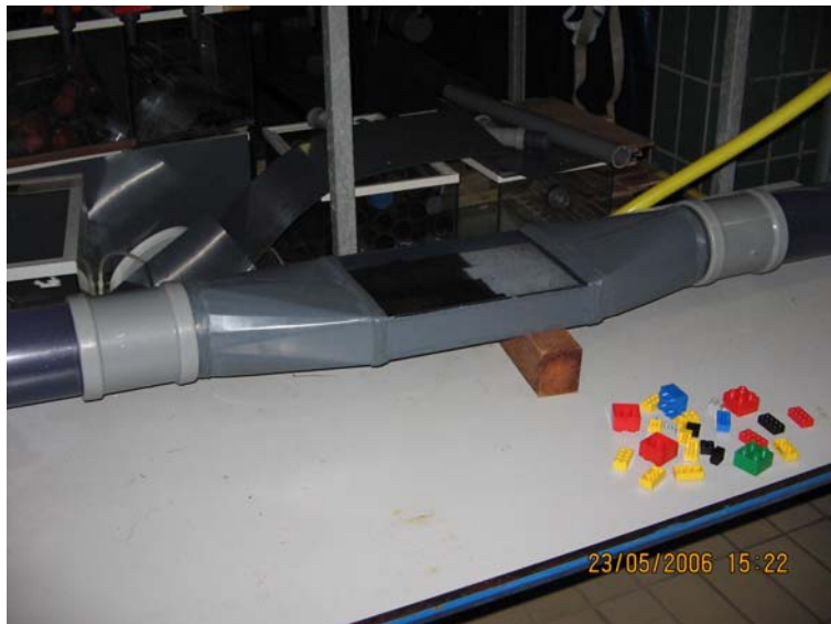
Figuur 6. Verbindingsbuis experimentele opstelling tel/herkenningsapparatuur.