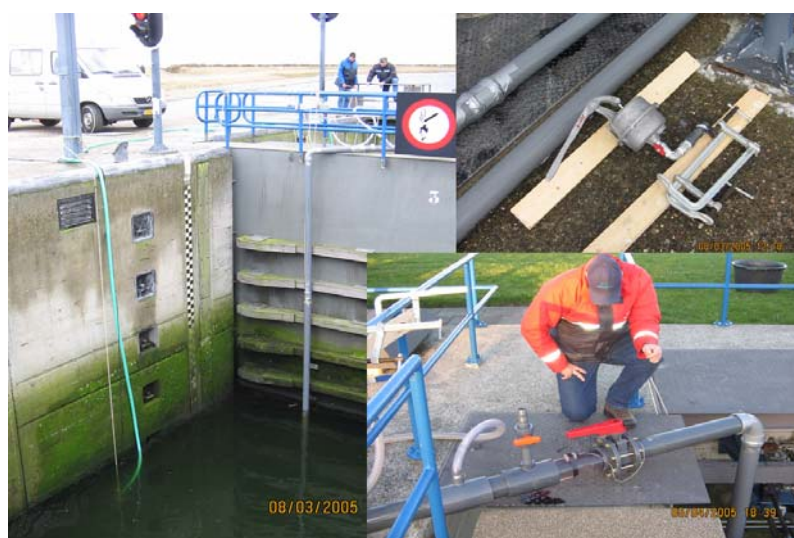
Figuur 3. Foto-Impressie van de vacuümpomphevel.

De drukpomphevel bestond uit een flexibele buis van 40 mm binnendiameter (75 m lengte). Deze buis werd bij de Prommelsluis over de zeedijk gelegd, waardoor zeewater uit de Oosterschelde overgeheveld kon worden naar de achterliggende polder (zie Figuur 4). Hierbij werd een horizontale afstand overbrugd van 75 meter, bij een opvoerhoogte van rond de 9