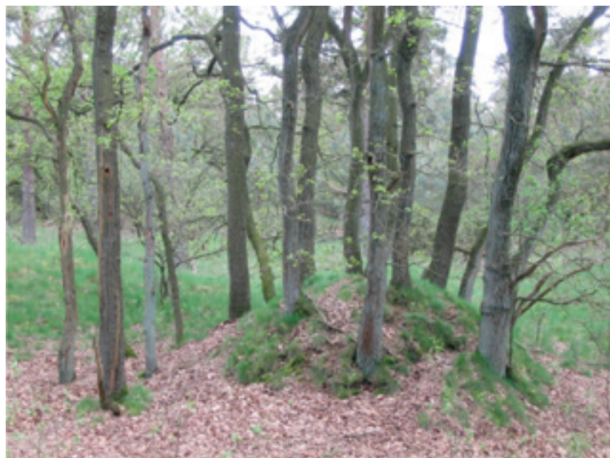
Eikencluster met stuifzandduin in Maanschoten. De stammen behoren toe aan één individu.

Het bleek niet mogelijk om op basis van bladkenmerken te bepalen of een cluster uit één kloon bestaat of niet. Uiteraard lijken bladeren aan stammen van eenzelfde kloon veel op elkaar, maar tegelijkertijd kunnen deze nauwelijks verschillen van bladeren aan andere klonen. Ook het opgraven van een cluster en het inventariseren van de ondergrondse structuur geeft geen uitsluitsel op de vraag of de stammen klonen zijn van elkaar. Naast het feit