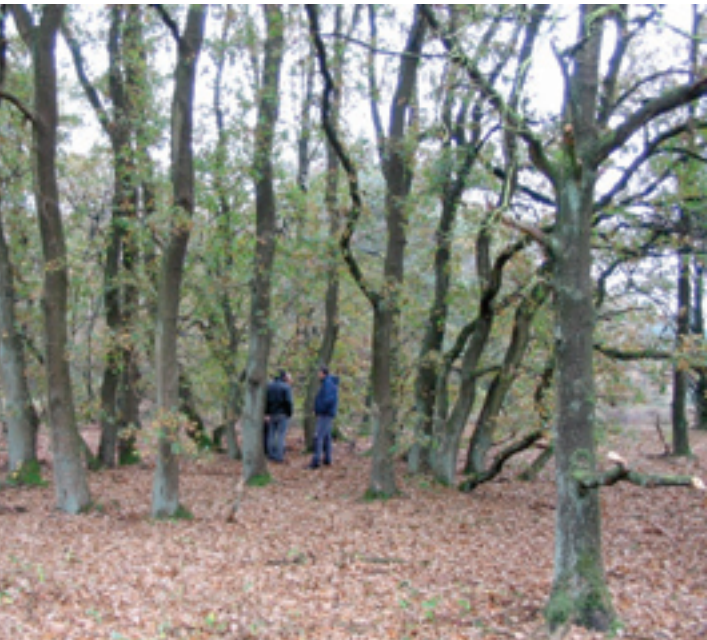
De grootste gevonden eikencluster op de Wilde Kamp, bestaande uit één genetisch individu, met een omtrek van 26 meter.

Op de kadastrale kaarten van 1832 zijn de gebieden met de grote eikenclusters in Maanschoten beschreven als heide. Het gebied