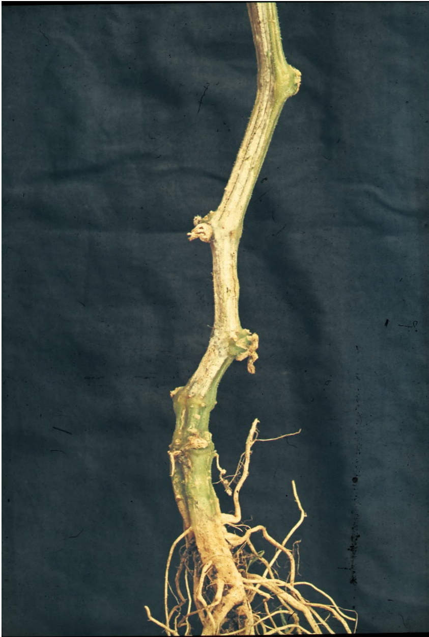
Eenzijdige verkleuring van de stengel met stengelvoetrot door Fusarium oxysporum f.sp. radicis-