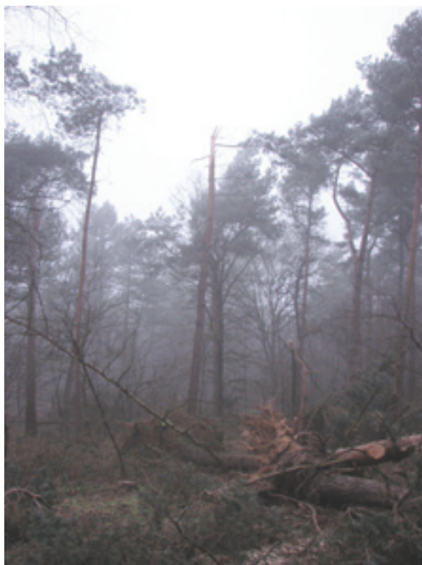
Stormschadebeeld in de Overloonse duinen na de 18 januari storm. Mogelijk moeten we hier meer rekening mee gaan houden.

de droge kant - als opvolger van de door ziekte geveld iepen - ook steeds meer esdoorn. Beuk speelt op de kleigronden in de natuurlijke vegetatieontwikkeling geen enkele rol, eik wel, zij het niet dominant en alleen aan de droge kant. Klimaatverandering zal hier geen grote veranderingen bewerkstelligen, zij het dat aan de natte kant wat meer als te verwachten is en dat over het geheel genomen de prognoses voor esdoorn wat minster gunstig zijn geworden.