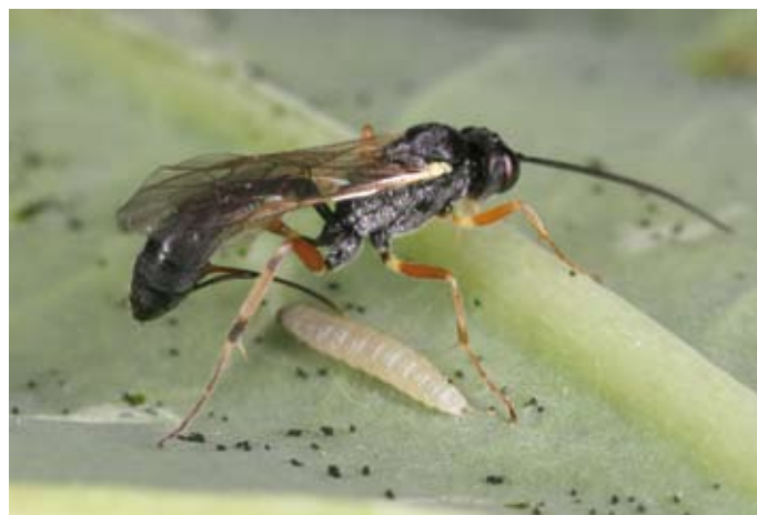
2. De sluipwesp Diadegma semiclausum legt haar ei in de gastheer, een rups van het koolmotje ( Plutella xylostella ). The parasitoid Diadegma semiclausum is ovipositing in its host, a larva of the diamondback moth ( Plutella xylostella ).

In mengteelten, die ingewikkelder voedselwebben hebben dan monocultures, verhoogt een grotere soortenrijkdom aan herbivoren en natuurlijke vijanden het aantal interacties tussen de drie trofische niveaus. De indirecte effecten van plantendiversiteit op interacties tussen carnivorensoorten die dezelfde herbivoren vreten of parasiteren, kunnen alleen worden vastgesteld als de hele levensgemeenschap onder de loep wordt genomen. Zo kan in een mengteelt de zoekefficiëntie van een parasiet afnemen door de aanwezigheid van een herbivoor die geen gastheer is van die parasiet. Dit kan er in theorie zelfs toe leiden dat verschillende parasietensoorten die dezelfde gastheer gebruiken in die mengteelt kunnen samenleven (Vos et al. 2001). Vaak wordt het effect van een bepaalde natuurlijke vijand op een plaagorganisme in afzondering gemeten. In werkelijkheid hebben we te maken met een complex aan natuurlijke vijanden (specialisten en generalisten) die alle meer of minder bijdragen aan de plaagsterfte. Predatie door generalisten kan daarbij zowel positief als negatief worden beïnvloed door de aanwezigheid van andere prooien. Voor een volledig beeld van de efficiëntie van natuurlijke vijanden moet dan ook de sterfte worden bepaald van alle herbivoren door alle carnivoren tezamen.