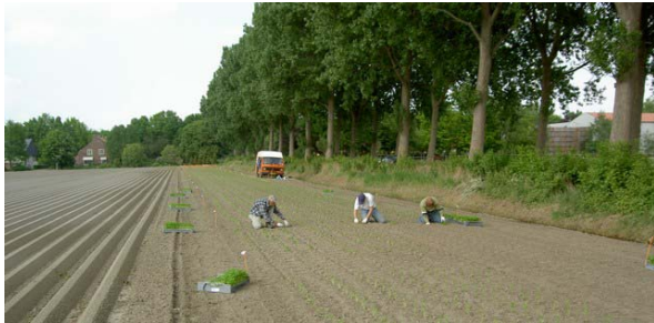
Foto 5. Planten van de knolselderij.