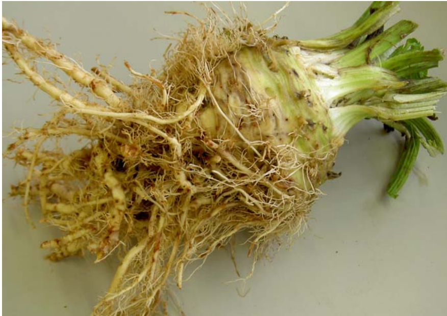
Foto 2. Schade door de wortelvliegmade in de knol.