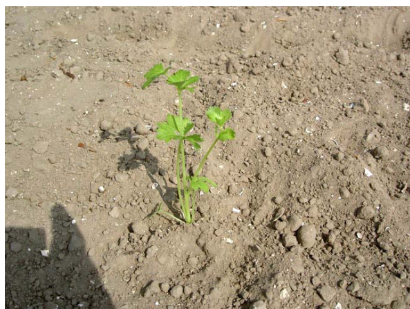
Foto 3 en 4. Plant stadium tijdens het planten.