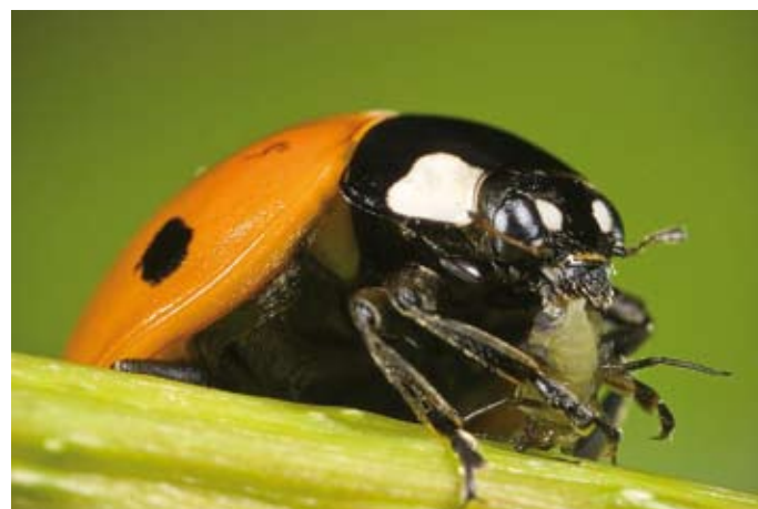
1. Coccinella septempunctata eet een bladluis. Coccinella septempunctata eats an aphid.

broedplaats voor lieveheersbeestjes. Vrouwtjes zetten hun eieren in clusters af in de buurt van bladluiskolonies, die voedsel voor hun nakomelingen verschaffen. Omdat bladluiskolonies in korte tijd exponentieel groeien en daarna van nature weer snel afnemen, is de aanwezigheid van bladluiskolonies op een specifieke akker vaak maar van korte duur en slechts voldoende voor de ontwikkeling van één generatie van lieveheersbeestjes (Dixon 2000). Zonder bladluizen kunnen lieveheersbeestjes een tijdje overleven op alternatieve voedselbronnen: larven gaan dan over op kannibalisme, het prederen van larven en poppen van andere soorten lieveheersbeestjes, schimmelsporen (Triltsch 1997) en/of stuifmeel (pollen) (Lundgren et al. 2005). Volwassen lieveheersbeestjes hebben een uitgebreider assortiment aan geschikte prooien dan larven en voeden zich daarnaast met nectar, schimmelsporen en pollen (Pemberton & Vandenberg 1993, Ricci et al. 2005). Bij voedselgebrek zijn zij echter geneigd de akker te verlaten en, anders dan de larven, kun-